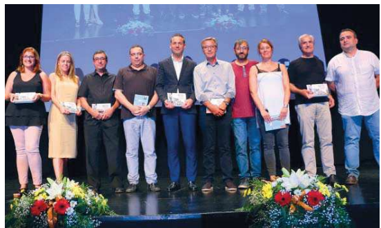
El jurat ha estat format per representats de les entitats, periodistes i treballadors de l'Ajuntament