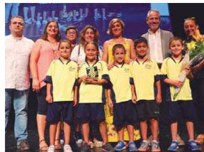
L'escola Reixac va ser reconeguda pel seu joc net als Jocs Escolars