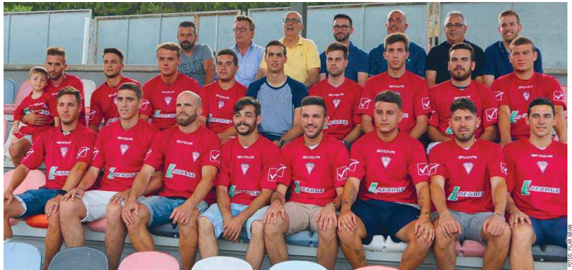
Tot i que van faltar alguns jugadors, el gruix de la nova plantilla de l'UE Sant Joan-Atlètic es va reunir per primer vegada el 7 de juliol a l'estadi de Can Sant Joan per presentar-se i començar a fer grup