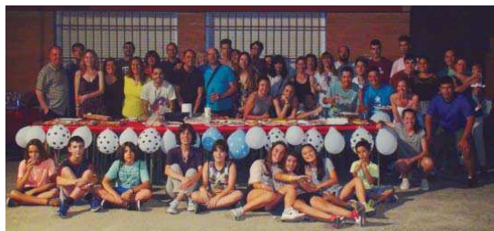
La família de l'AEE Montserrat Miró va tancar la temporada amb un sopar al pati de l'institut

L'AEE Montserrat Miró va celebrar el 8 de juliol un sopar de germanor al pati de l'institut per tancar la temporada 2016-17 en la que, segons els seus responsables, ha assolit els seus objectius de "creixer i consolidar-se" com a entitat esportiva amb un nom propi al municipi i "fer més visible un esport com el korfbal que tants bons valors aporta a la comunitat". A nivell institucional, el club va organitzar, amb la col·laboració de l'IME, dues jornades KIDS i una activitat en el marc de la Festa Major i també va presentar la seva candidatura per acollir l'Europa Shield 2018, que finalment es disputarà a Platja d'Aro.